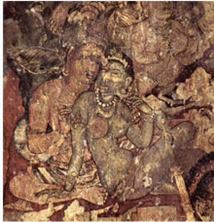
จิตรกรรมฝาผนังจากอจันตา (Ajanta) คริสต์ศตวรรษที่ 6

จิตรกรรมฝาผนังปูนเปียก (Fresco) คืออะไร จิตรกรรมฝาผนัง (ภาษาอังกฤษ : Fresco) คือ ภาพเขียนหลายชนิดที่เขียนบนปูนบนผนังหรือเพดาน คำว่า “fresco” มาจากภาษาอิตาลี “alfresco” ซึ่งมาจากคำว่า “fresco” หรือ “สด” รากศัพท์มาจากภาษาเยอรมนี