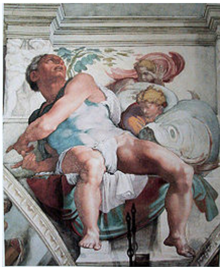
จิตรกรรมฝาผนังในซาเปลซิสตินที่ วาติกัน, โรม ประเทศอิตาลี

จิตรกรรมฝาผนังปูนเปียก เป็นการเขียนภาพที่มีลักษณะ การเตรียมพื้น การลงสี เป็นไปตามธรรมชาติมากเทคนิคหนึ่ง วัสดุที่ใช้เกิดขึ้นตามกระบวนการธรรมชาติ เป็นการใช้วัสดุ ในกระบวนการทำงานนี้ อย่างเข้าใจธรรมชาติของวัสดุในการทำงาน จิตรกรรมฝาผนังปูนเปียก ที่น่าจะเก่าแก่ที่สุด คือ เมื่อ 1,500 ปี ก่อนคริสตศักราช พบที่เกาะครีต (Crete) ที่ประเทศกรีซ ชิ้นที่สำคัญที่สุดเรียกว่า “The Toreador” ซึ่งเป็นเรื่องราวของพิธีศักดิ์สิทธิ์ที่คนกระโดดข้ามหลังวัว ในสมัยโรมันที่เมืองปอมเปอี เมืองนี้จมอยู่ในเถ้าถ่านภูเขาไฟมาเป็นเวลา 2,000 ปีมาแล้ว แต่ยังคงสภาพความคงทนอยู่ได้