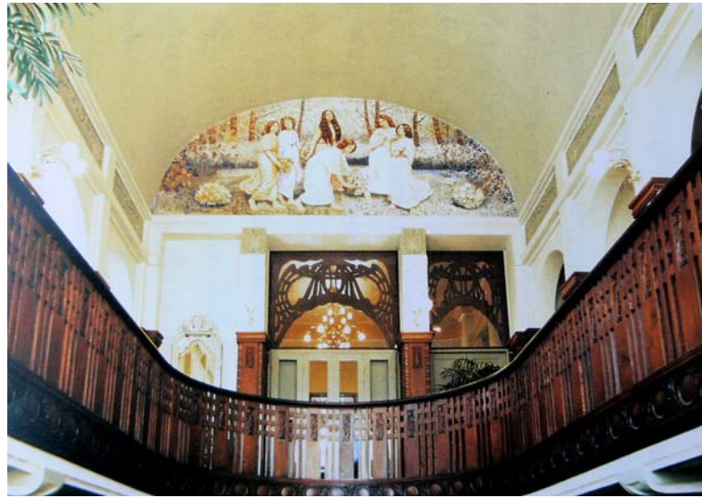
ภาพที่ 1 ภาพจิตรกรรมฝาผนังภายในวังบางขุนพรหม