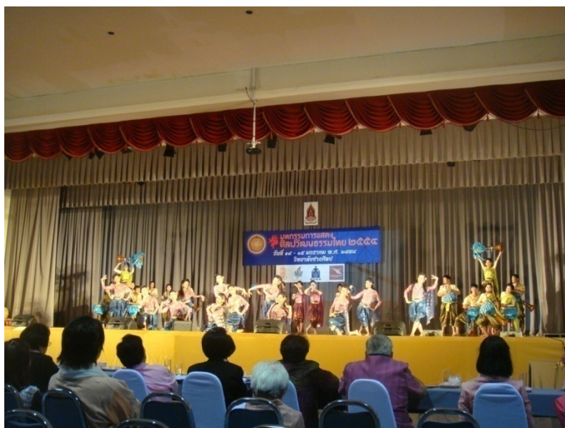
การแสดงนาฏศิลป์ไทย