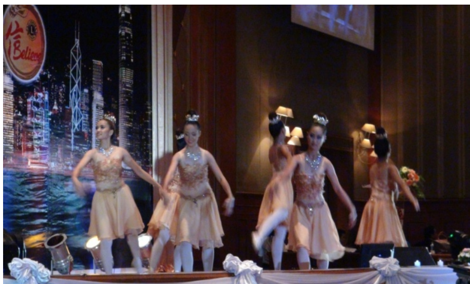
การแสดงนาฏศิลป์สากล