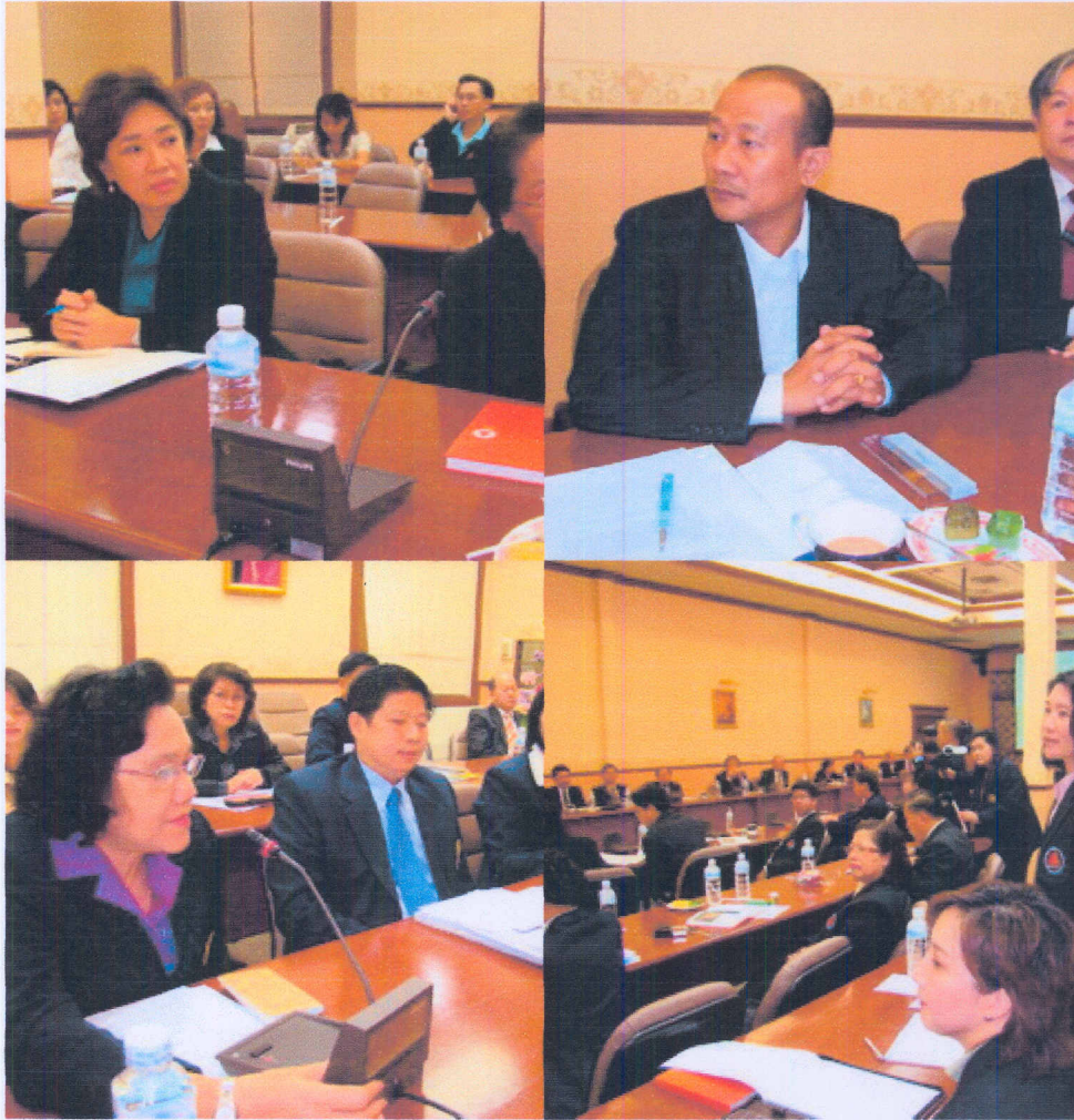
ภาพ บัลลังก์ สำนักงานรัฐมนตรี