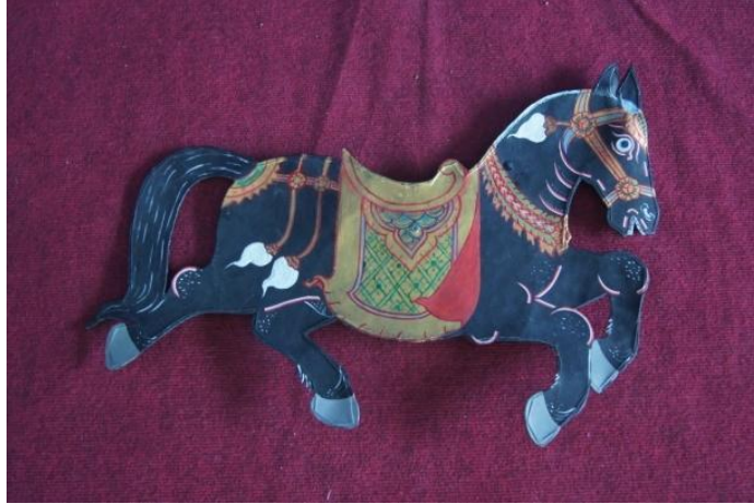
ภาพที่ ๒.๑๒ ม้า

อุปกรณ์ประกอบอื่นๆ เช่น ม้า ใช้เป็นพาหนะประกอบการเดินทางของตัวละคร