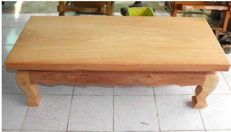
ภาพที่ ๒.๖ เตียง

เตียง เป็นเตียงไม้สีแดง ๔ ขารูปสี่เหลี่ยมผืนผ้าตั้งอยู่บนเวที