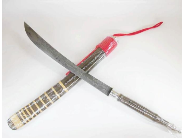
ภาพที่ ๒.๑๐ ดาบ