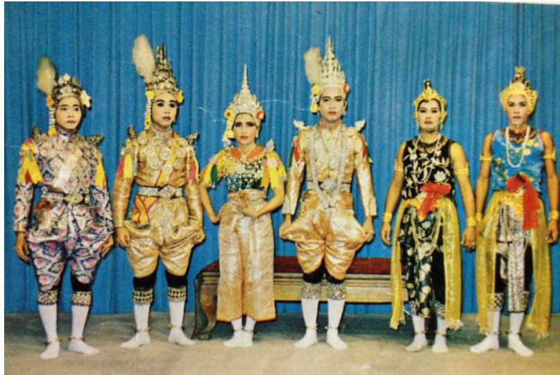
ภาพที่ ๒.๓ การแต่งกายของตัวละครในเรื่องอิเหนา ตอนศึกกะหมังกูหนิง

ในสมัยนั้นพระพรภิรมย์ เป็นพระเอกลิเกมีการนุ่งกางเกงส่วนนายบุญเลิศ นางพินิจ ใช้การนุ่งผ้าม่วง และมีการสวมกางเกงเข้าไปด้วยลักษณะคล้ายกับละคร ภายหลังพอจะเล่นเป็น เรื่องอย่างละครเรื่องหนึ่งๆ มีการแต่งแบบละคร (แต่งตามเชื้อชาติ) ลักษณะดังกล่าวนี้ เรียกว่า ลิเกพันทาง