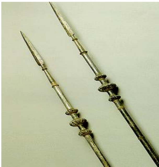
ภาพที่ ๒.๙ ทวน

อาวุธ เช่น ดาบ หอก ขวาน ทวน เป็นอาวุธที่ใช้สำหรับการสู้รบ วิธีการเลือกใช้นั้นขึ้นอยู่กับเรื่องหรือตอนที่แสดง เช่น เรื่องอิเหนา ใช้กริช เรื่องจันทโครพ ใช้ดาบ เป็นต้น