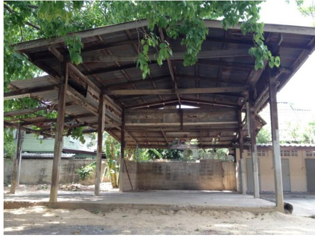
ภาพที่ ๒.๑๔ เวทีลิเกแบบถาวร ประเภทไม่ยกพื้น จากวัดทองคั้ง ตำบลโพสะ อำเภอเมือง จังหวัดอ่างทอง(ด้านหน้า) ที่มา : คณะผู้ศึกษา (๓๐ มีนาคม ๒๕๕๗.)

เวทีลิเกมี ๒ แบบ คือ แบบยกพื้นเล็กน้อย กับ แบบปิดวิก เวทีลิเกแบบเดิม เป็นเวทีติดดิน หรือยกพื้นเล็กน้อย ทำด้วยไม้ มีหลังคาที่เป็นทรงหมาแหงน แบ่งพื้นที่เป็น ๓ ส่วนคือ เวทีแสดง หลังเวทีซึ่งใช้สำหรับเตรียมตัวก่อนออกแสดงหรือพักผ่อน และเวทีดนตรี เวทีลิเกมีขนาดมาตรฐาน คือ กว้าง ๖ เมตร ลึก ๖ เมตร หลังคาหน้าเวทีสูงจากพื้นดินประมาณ ๔.๕๐ เมตร ตรงส่วนที่ผูกฉากสูง ๓.๕ เมตร หน้าฉากเป็นเวทีแสดง หลังฉากเป็นหลังเวที ถัดจากเวทีแสดงไปทางขวามือของผู้แสดงเป็นเวทีดนตรีสูงเสมอกันจะเป็นปีกยื่นออกไป ขนาดกว้าง ๖ เมตร ลึก ๓ เมตร หันด้านกว้างไปทางซ้ายของเวที เวทีลิเกยกพื้นสูงจากพื้นดินประมาณ ๑ เมตร พื้นเวทีลิเกจะโล่ง ไปด้วยเสื่อหรือพรม มีเพียง ๑ ตัว ตั้งอยู่กลางเวทีเวทีลิเกแบบปิดวิก เป็นโรงสร้างด้วยไม้ ปลูกติดพื้นดิน ขิดถนนมีช่องระบายโดยขอบหลังคาจั่วมุงสังกะสี หน้าจั่วหันออกถนนมีทางเข้าออกทางเดียวเป็น ประตูบานใหญ่ มีที่ขายตั๋วทั้งสองข้างถัดจากทางเข้ามีม่านกันสายตาคนภายนอก เวทีเป็นพื้นไม้ กว้างประมาณ ๘ เมตร ลึก ๔ เมตร ยกสูงจากพื้นดิน มีบันได ๔ ชั้น ขึ้นทางด้านหน้า ๒บันได เวทีหันหน้าไปทางประตูเข้าวิกมีม่านเรียบ ๆ ไม่ได้เขียนอะไรใช้ชิงกันหลังประตูสองข้างเข้าออก ถัดประตูด้านขวาเป็นที่ตั้งปีพาทย์ ตัวเวทีมีพรมผืนใหญ่ปูเต็มหลังเวทียกพื้นเสมอกับเวที ๒ ข้าง เวที ๒ ข้าง กันคอกเล็ก ๆ ด้วย