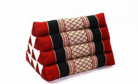
ภาพที่ ๒.๗ หมอนสามเหลี่ยม หรือหมอนขวาน (๓๐ มีนาคม ๒๕๕๗.)