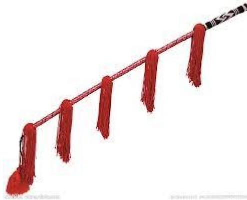
ภาพที่ ๒.๑๑ แห่