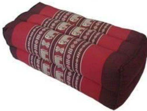
ภาพที่ ๒.๘ หมอนสี่เหลี่ยม