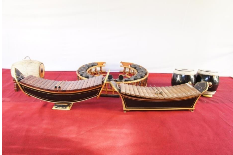
ภาพที่ ๒.๑ วงปี่พาทย์เครื่องห้า