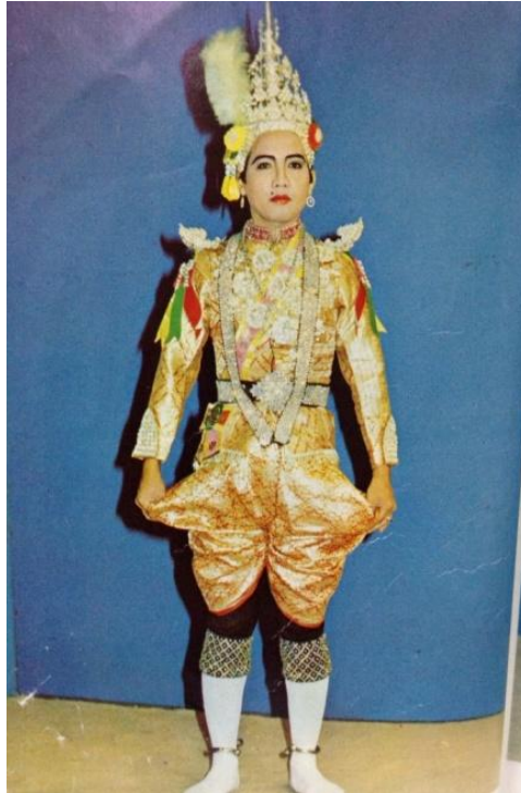
ภาพที่ ๒.๕ การแต่งกายลิเกทรงเครื่อง (ตัวพระ) ที่มา : คณะผู้ศึกษา (๓๐ มีนาคม ๒๕๕๗.)