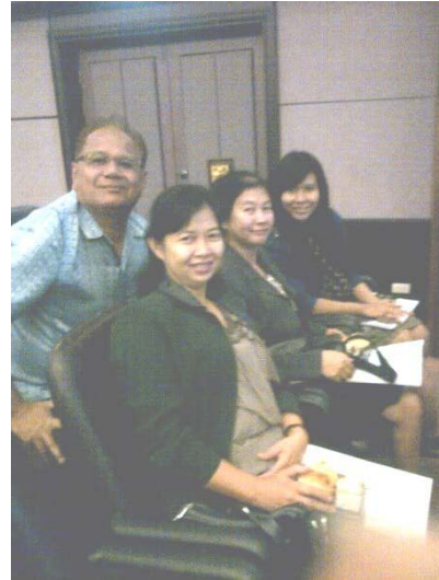
เข้าร่วมโครงการพัฒนาศักยภาพด้านการจัดการความรู้ (รุ่นที่ ๑) ครั้งที่ ๑ วันที่ ๒๐-๒๑ มกราคม ๒๕๕๖