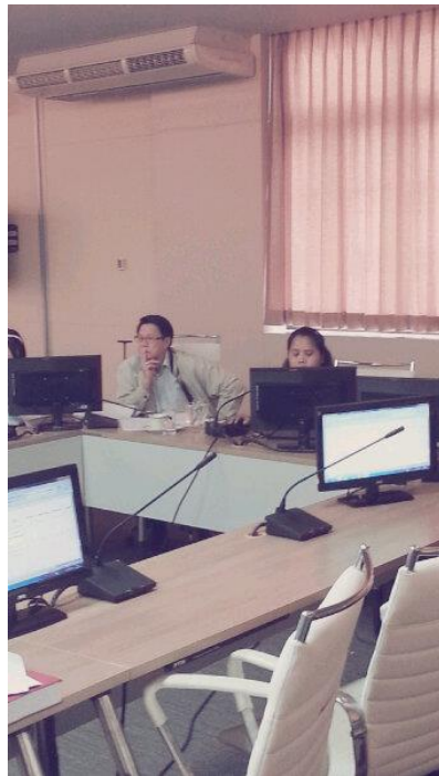
๒๑ มกราคม ๒๕๕๕