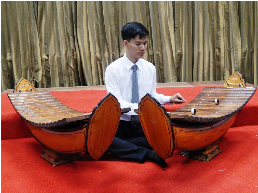
ทำนองการบรรเลงระนาดเอก 2 ราง