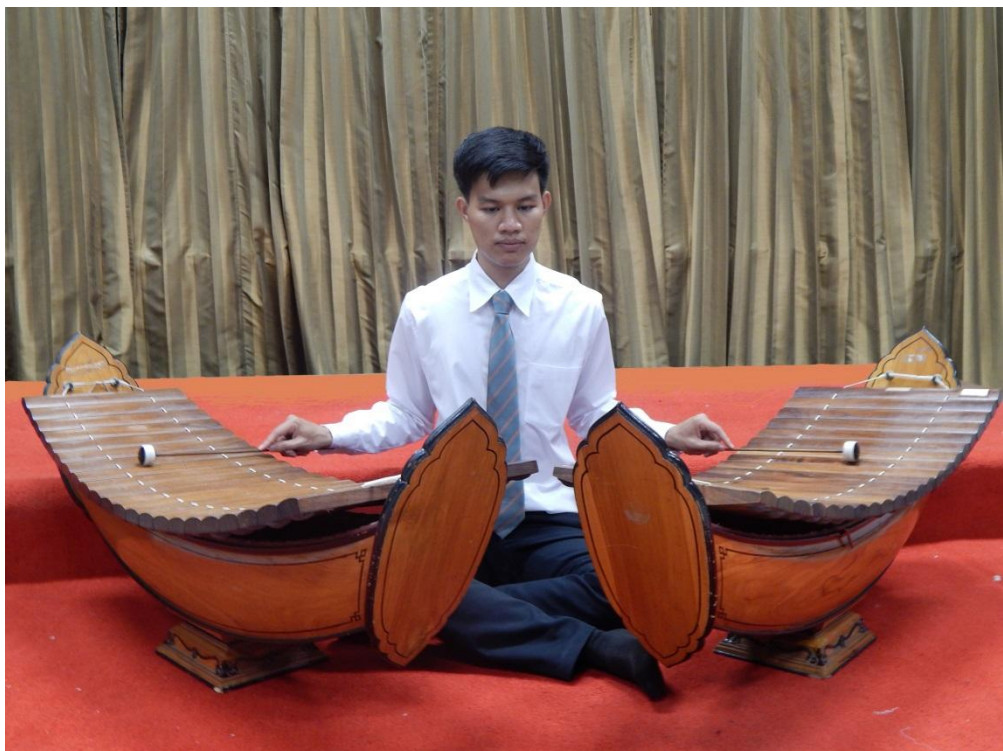
กระบวนการที่ 2 การเลือกเครื่องดนตรี